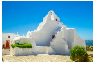
帕拉波尔蒂阿尼教堂