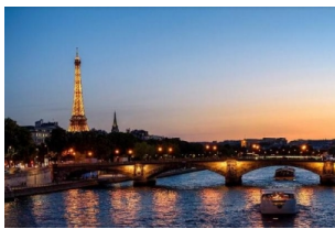
【重点推荐】巴黎夜游