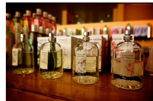
巴黎花宫娜香水博物馆