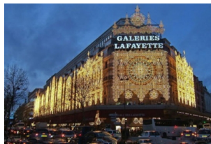
老佛爷百货公司（奥斯曼旗舰店）