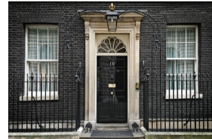
唐宁街10号英国首相府官邸