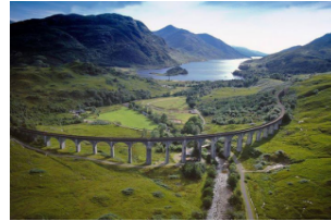
格兰芬南铁路高架桥