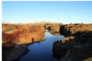
冰岛古议会旧址(露天议会)

极光是一种概率性的大自然天文奇观，一般发生在高纬度地区的深夜。受天气影响较大，无法保证一定会有极光出现。