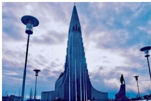
哈尔格林姆斯教堂